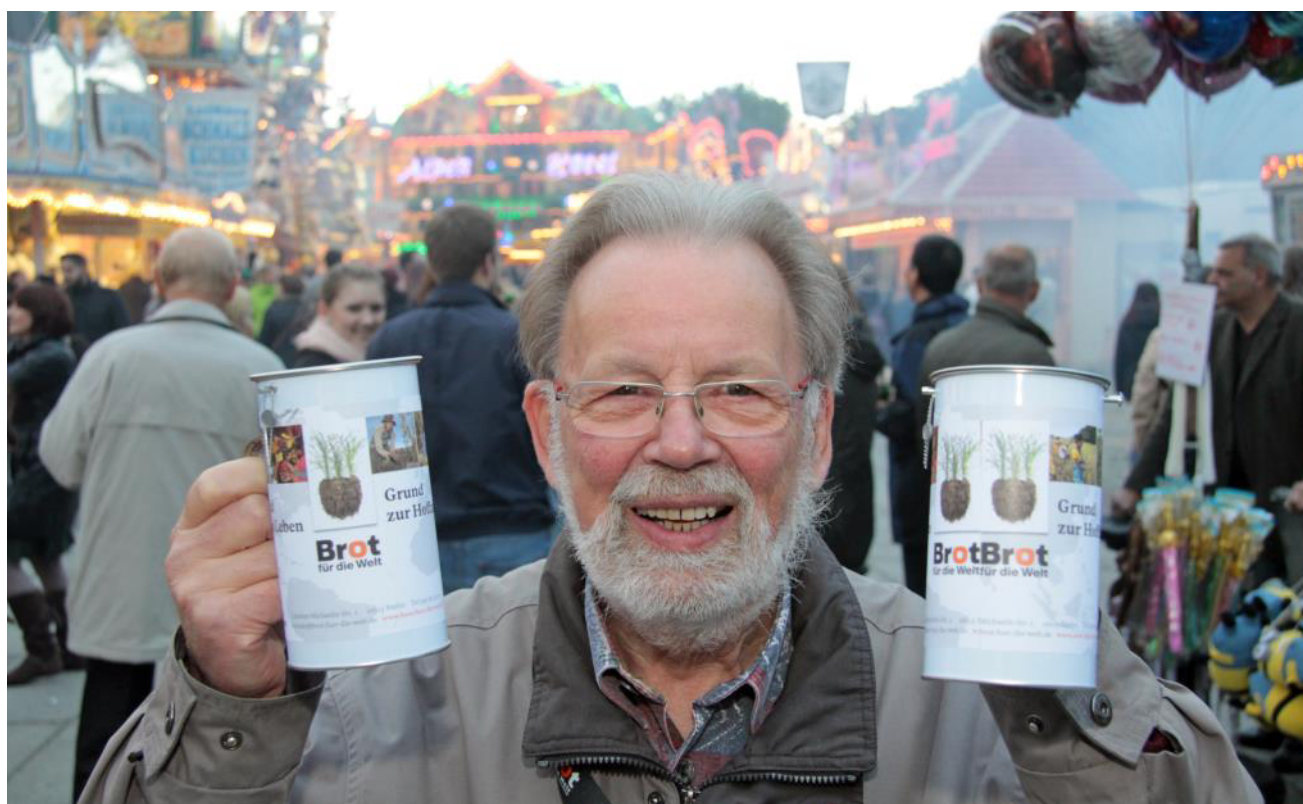
Ohne Ehrenamtliche nicht zu schaffen: Die Sammlungen für Diakonie und Brot für die Welt.

in der eigenen Gemeinde. Dreißig Prozent kommt der Diakonie im Kirchenbezirk zugute. Es lohnt sich also, als Gemeinde und Bezirk tatkräftig an dieser Aktion mitzumachen. Früher zogen in vielen Gemeinden Sammlerinnen und Sammler von Tür zu Tür und hielten durch diese Besuche zugleich den Kontakt zu den Gemeindegliedern. Heute ist die Sammlung meist nicht auf eine einzige Woche beschränkt, denn die meisten Gemeinden werben vor allem durch Flyer im Gemeindebrief im Frühjahr (Passion/Ostern/Pfingsten) über einen längeren Zeitraum. Noch immer ist die Woche der Diakonie die wichtigste Sammelaktion neben Brot für die Welt. Die Erträge dieser verpflichtenden Sammlungen und Kollekten werden über die Dekanate an die Landeskirchenkasse abgeführt.