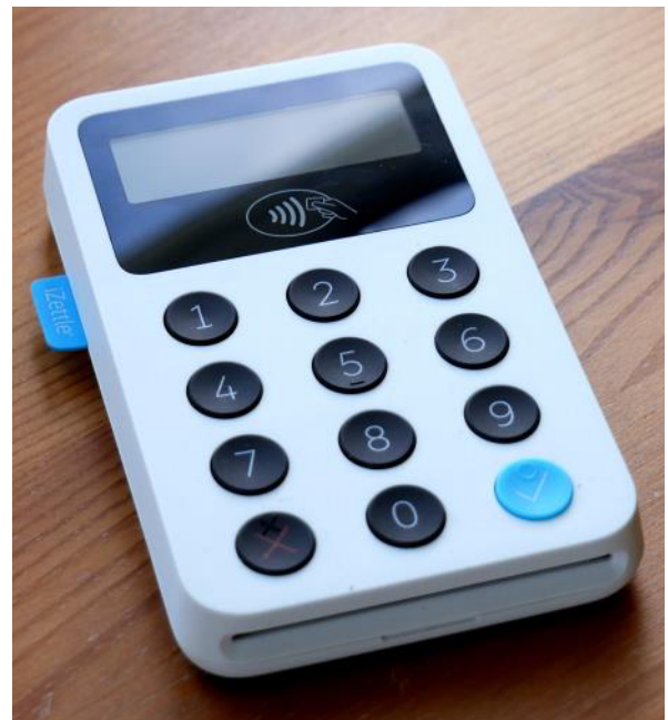
Kleine Kartenlesegeräte erfüllen bei geringeren Anschaffungs- und Betriebskosten denselben Zweck.

Noch gibt es keine Lösung, die vollständig überzeugt.