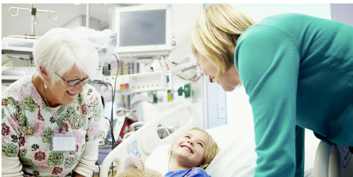
Die Empfänger*innen der Kollekten freuen sich über eine zeitnahe Überweisung: Das ist die Grundlage für ihre Arbeit!

Kollekten, die nicht bei der Kirchengemeinde bleiben, werden im Sachbuch 51 „verwahrt“. Das heißt: sie tauchen nicht im ordentlichen Haushalt der Kirchengemeinde auf, sondern werden an den Kirchenbezirk, die Landeskirche oder andere Empfänger*innen weitergeleitet.