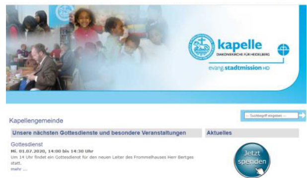
Spendenbutton auf der Homepage der Kapellengemeinde Heidelberg.

Diese Projekte präsentieren wir nicht auf www.gutes-spenden.de . Aber wir generieren einen Steuerungscode, mit dem Sie einen Spendenbutton auf Ihrer eigenen Homepage integrieren können.