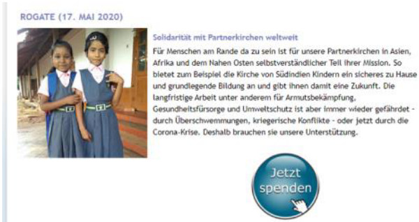
Kollektenzwecke auf www.ekiba.de/kollekten online bespendbar.

Der jeweils aktuellste Kollektenzweck steht auf dieser ekiba-Kollektenseite oben, die anderen bleiben aber noch eine Weile sichtbar.