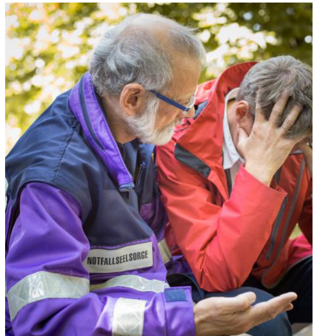
Übergemeindliche Dienste wie die Notfallseelsorge sind auf die Finanzierung aus Kollektengeldern dringend angewiesen.

te und Werke eine wesentliche Einnahmequelle, welche durch eine normierte Zuweisung ausgeglichen werden müsste. Gleichzeitig würde ein wichtiger Berührungspunkt zur gemeindlichen Lebenswelt fehlen.