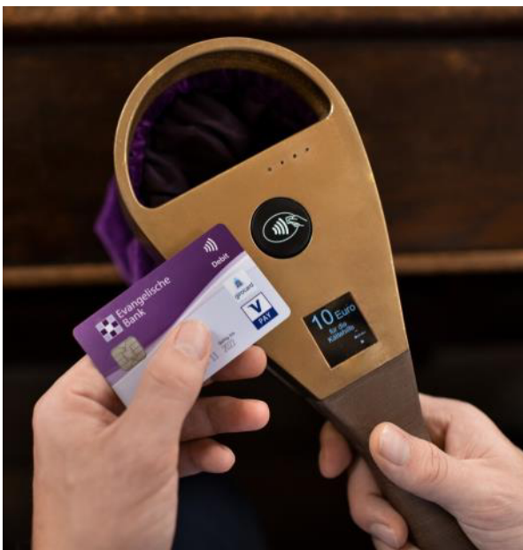
Der digitale „Klingelbeutel“ kommt in der einen oder anderen Form früher oder später.

Auch unsere Zahlungsmittel werden zunehmend digitalisiert. Es wird unter Fachleuten immer häufiger bereits über das Ende des Bargeldes nachgedacht. Für einige unserer Gemeindeglieder ist es bereits normal, im Alltag bargeldlos per EC- bzw. Kreditkarte oder via App zu bezahlen. Diese Entwicklung betrifft absehbar auch die Sammlungen in unseren Gottesdiensten. Einige Gemeinden in Deutschland experimentieren mit Kartenlesegeräten, die teils in Klingelbeutelform daherkommen. Andere setzen auf das Handy, das viele Menschen sowieso dabei haben. Mit QR-Codes und e-Wallets wie PayPal oder ApplePay ist das Online-Spenden genauso einfach wie das Online-Einkaufen.