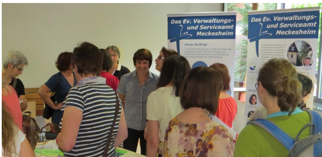
Die Verwaltungs- und Serviceämter (in der Fläche) oder die Kirchenverwaltungsämter (in den Großstädten) sind Ihre kompetenten Ansprechpartner.

Kollekten und Opfer werden grundsätzlich von Spenden unterschieden. Letztere werden unter 22xx gebucht.