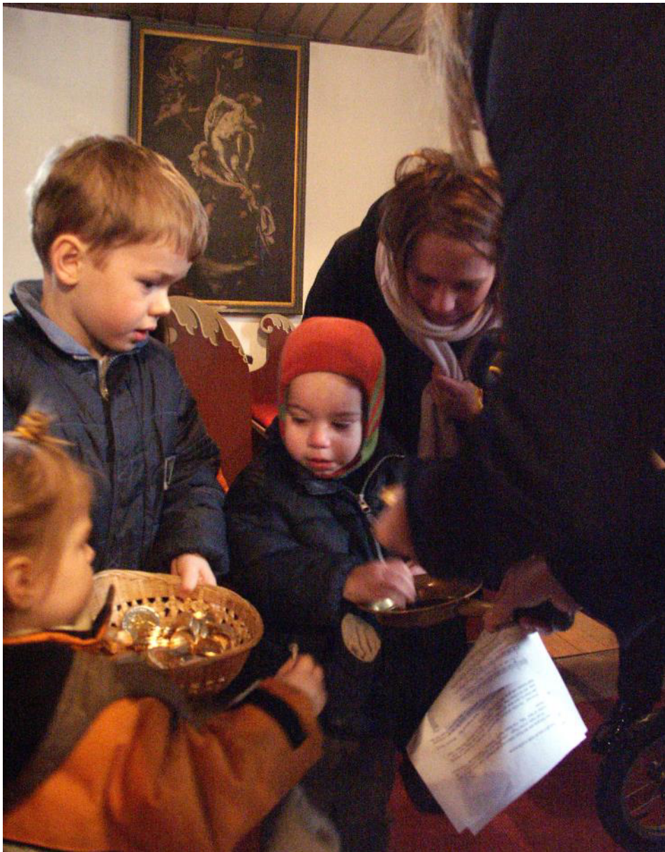
Früh übt sich: Kollektensammlung in einem Kindergottesdienst.

Umgekehrt wäre es aber genauso wünschenswert, wenn Kinder- und Jugendthemen auch bei den Kollekten der Erwachsenengottesdienste eine Rolle spielen.