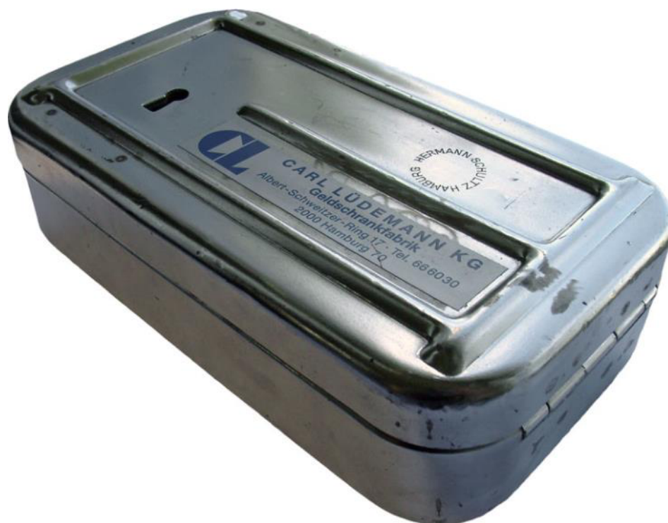
Die gute alte „Geldbombe“ hat leider fast überall ausgedient.

Die Verwaltungsvorschriften sollen demnächst überarbeitet werden, um Verfahrenswege zu beschreiben, die den veränderten Rahmenbedingungen gerecht werden. Wir halten Sie auf dem Laufenden.