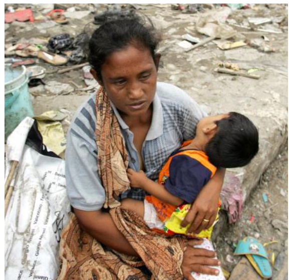
Bei Naturkatastrophen (wie dem Tsunami 2018 in Sulawesi, Indonesien) oder den verheerenden Überschwemmungen in Südindien 2018/ 19 ist schnelle Hilfe erforderlich.