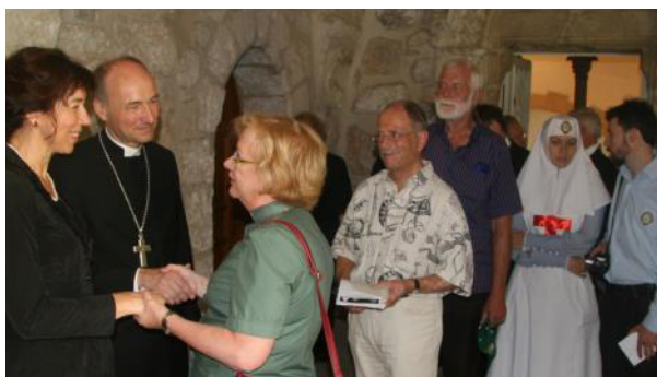
„Ökumene und Auslandsarbeit“ konkret: die Evangelische Gemeinde deutscher Sprache in Jerusalem.

Im Kollektenplan bereits enthalten sind jährlich vier EKD-Pflichtkollekten, die deutschlandweit erbeten werden.